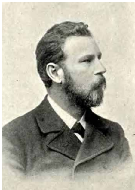
Karol Knaus

Rada Dzielnicy X Swoszowice pozytywnie zaopiniowała propozycję, aby jednym z patronów ulic na terenie Dziesiątki został Karol Knaus. Chodzi o niewielką drogę na terenie Klinów, nieopodal ul. Zakościańskiej. Karol Knaus żył w latach 1846-1904. Był architektem, budowniczym i artystą. Efekty jego pracy można zobaczyć na Kazimierzu, gdzie mieszkał. Zaprojektował