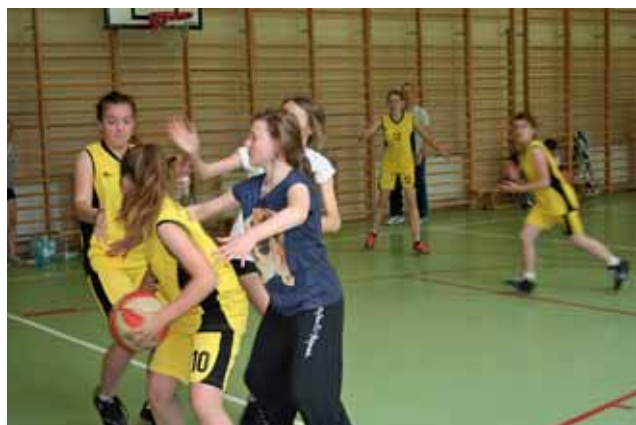
Mecze koszykarek były bardzo zacięte...