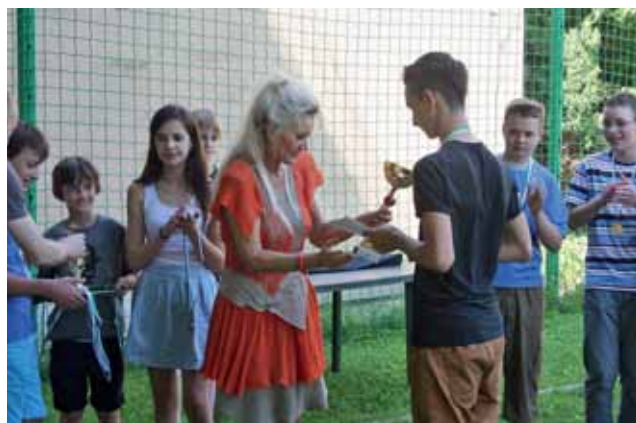
Uroczyste wręczenie nagród